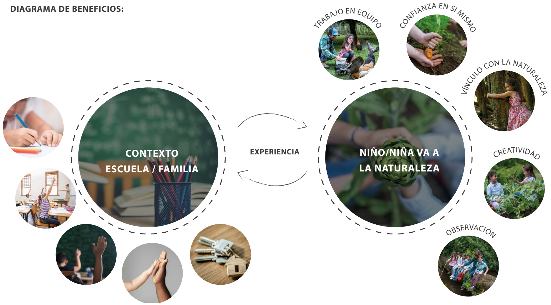
DIAGRAMA DE BENEFICIOS: